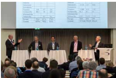
Podiumsdiskussion beim Schlauchlinertag