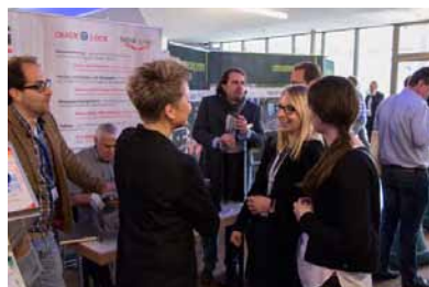
Fachgespräche am Stand der Uhrig Kanaltechnik GmbH