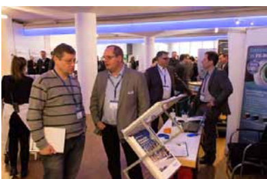
Fachgespräch am Stand der Wavin GmbH