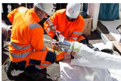
Außenvorfürhng der Aarsleff Rohr-sanierung GmbH