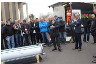
Außenvorfürhng der Relineurope AG