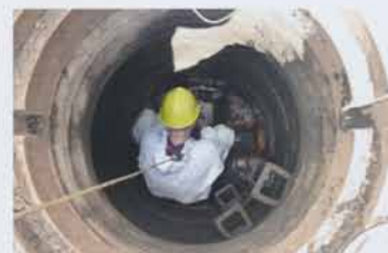
Sanierung eines Schachtes