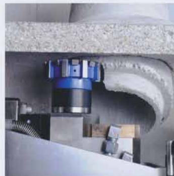
Auffräsen eines Zulaufs

und Abfall e.V. (DWA) durchgeführten Umfragen zum Zustand der Kanalisation deutlich. Der Gesamtzustand, so die Erkenntnis, hat sich noch nicht verbessert – trotz erhöhter Investitionen und der Tatsache, dass Reparaturverfahren auf dem Vormarsch sind. Denn gut ein Drittel aller Sanierungen, nämlich 36%, wurden 2009 mit Ausbesserungs-, Injektions- oder Abdichtungsverfahren durchgeführt. Das Problem: Oft mangelt es bei der Planung und Durchführung von Arbeiten am Leitungsnetz am Bewusstsein dafür, dass der pflegliche Umgang mit dem Gut Kanalisation und dessen Erhalt auch mit Blick auf die Umwelt sowie nachfolgende Generationen geboten ist. Anders gesagt: Billig wird am Ende teuer, die Zeche für Flickschusterei zahlen