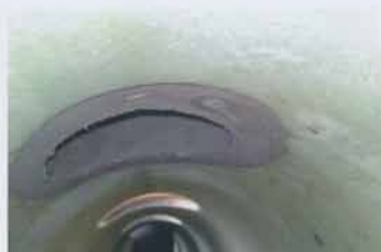
Nach der Reparatur: fachgerecht eingebundener Stutzen

Doch das Programm kann noch mit weiteren Höhepunkten aufwarten. Erstmals bietet der Deutsche Reparaturtag nicht nur eine Reihe von informativen Fachvorträgen sowie eine begleitende Ausstellung, sondern auch konkrete Anschauungsbeispiele. Der neugeschaffene Themenblock III macht moderne Reparaturlösungen erlebbar: Sechs Unternehmen präsen-