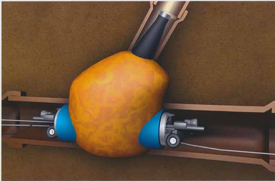
Stutzensanierung vor Packerabzug