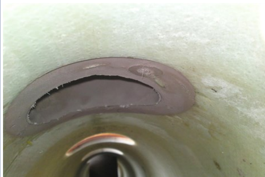
Nach der Reparatur: fachgerecht eingebundener Stutzen

Infos unter www.reparaturtag.de und www.sanierungs-berater.de